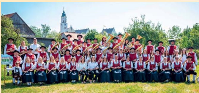
MV Babenhausen – musik. Leitung Andreas Keck