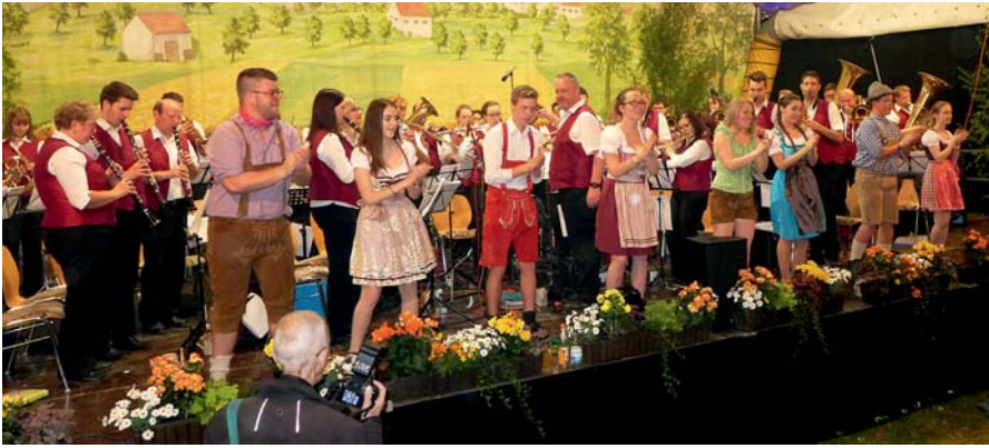
Der Musikverein „Harmonia“ Allmendingen sorgte im vergangenen Jahr auch als letzte Kapelle beim Blasmusikabend noch richtig für Stimmung. Ein Zeichen dafür, dass der Abend erst mit dem Auftritt der letzten Kapelle beendet ist.