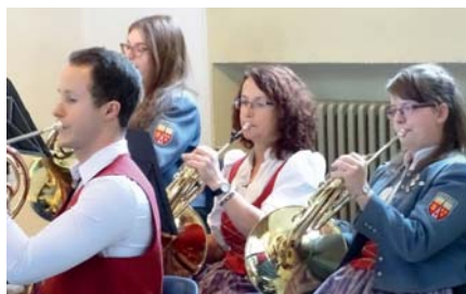
„Musik im Advent“ gibt es am Samstag, 15. Dezember 2018, in der Hauskapelle des Klosters „Maria Hilf“ in Untermarchtal. Das Foto entstand im vergangenen Jahr beim dortigen Konzert.

sem schon zur Tradition gewordenen Kirchenkonzert sind auch auswärtige Besucher herzlich eingeladen. Die Musiker sowie die Untermarchtaler