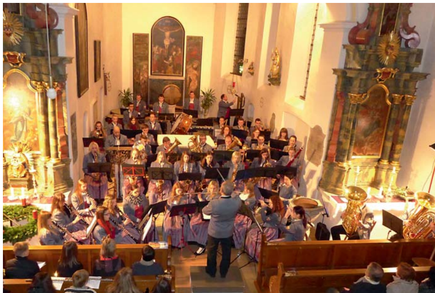
Unter dem Motto „Musik im Advent“ gestaltet die Musikkapelle Frankenhofen am Sonntag, 2. Dezember 2018 (1. Advent), um 18 Uhr in der St.-Georg-Kirche in Frankenhofen wieder ein weihnachtliches Konzert.