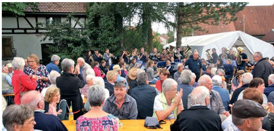
Der Musikverein Frankenhofen plant am Sonntag, 29. August, wieder sein traditionelles Gartenfest. Die entsprechende Corona-Verordnung wird eingehalten.