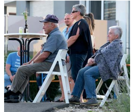
Aufmerksam und anscheinend mit Genuss lauschen die Zuhörer den Vorträgen von Chor und Musikkapelle.