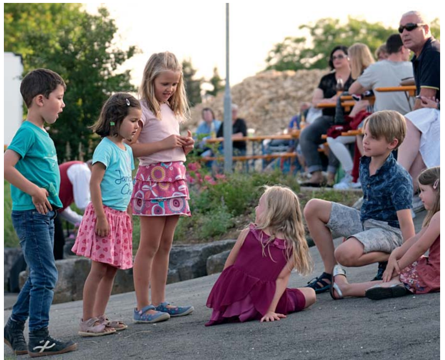
Selbst die vielen Kinder hatten ihren Spaß bei dem für die Augustenhöhe lauen Sommerabend. Der neue Spielplatz nebenan gab den Kids Gelegenheit, sich auszutoben.

Das kulinarische Angebot nahmen die Besucher rege in Anspruch, so dass die Käsewürfel mit Brezel schnell ausverkauft waren. Die „Rote mit oder ohne Senf“ musste dann noch herhalten und erinnerte viele Gäste an „schon länger“ zurückliegende Veranstaltungen. Die Musikanten gaben nach ihrem eininhalb-stündigem sehr